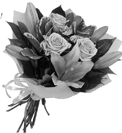
Жена, дети, внуки.

Юбилар наш дорогой, Статный, видный, озорной, Хоть и 70 уже – молодой еще в душе! Дорогой наш юбиляр, Ты совсем еще не стар, И пусть будут по плечу Все заветные «хочу»! И азарта не терять, Все сполна от жизни брать! Знай, что ты у нас всегда Суперстар-суперзвезда! Будь агентом 007 Будь примером ты нам всем, На диване не валяйся, На охоту отправляйся! Ждут леса тебя и воды, Что грустить в твои-то годы?! Ты про возраст свой забудь, Как и прежде супер будь!!!